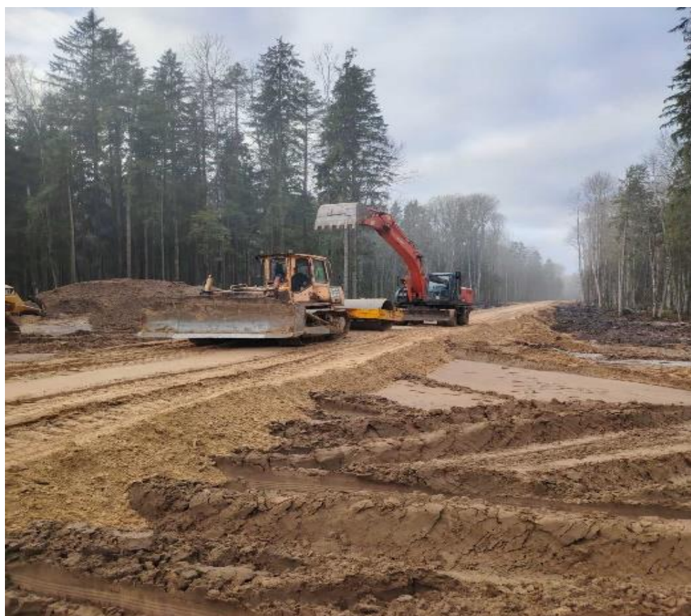
Строительство лесохозяйственной дороги ГЛХУ «Вилейский лесхоз»