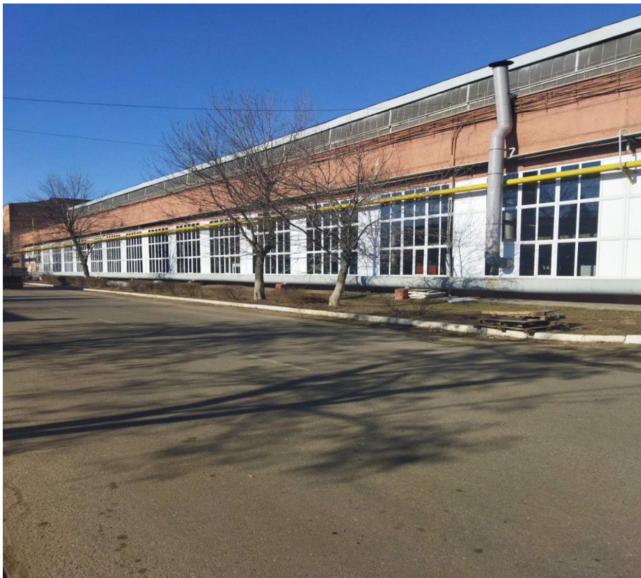
Реконструкция цехов ОАО «МАЗ»