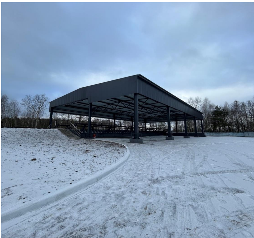
Повышенный путь с крытой площадкой ОАО «Мозырьсоль»