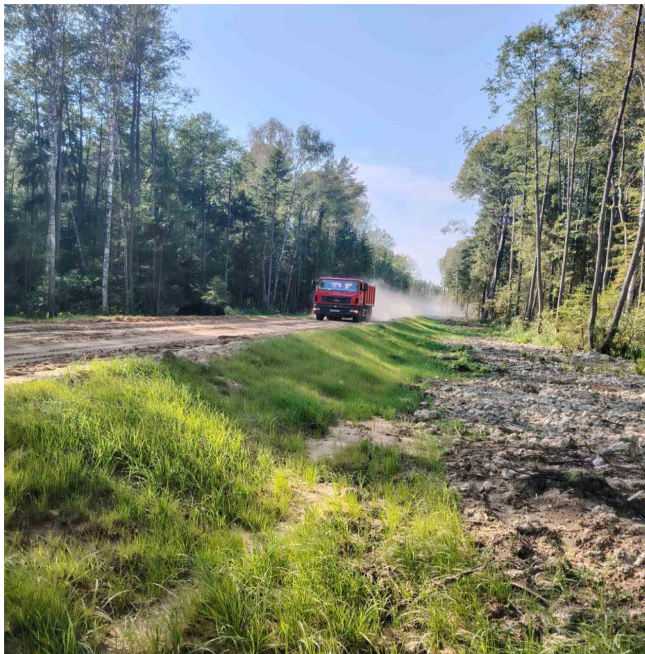
Строительство лесохозяйственной дороги ГЛХУ «Бобруйский лесхоз»