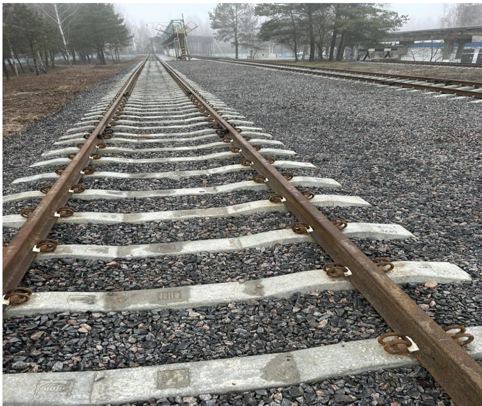
Повышенный путь с крытой площадкой ОАО «Мозырьсоль»