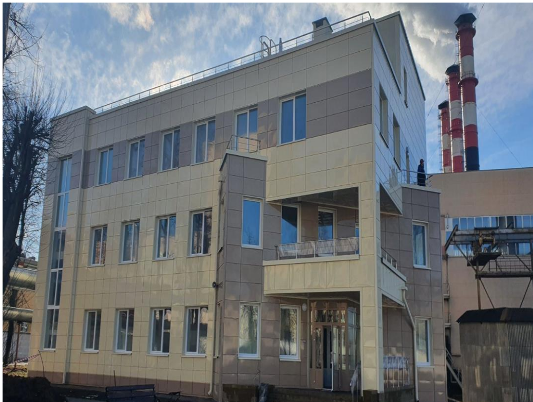
Строительство здания РУП МИНСКЭНЕРГО