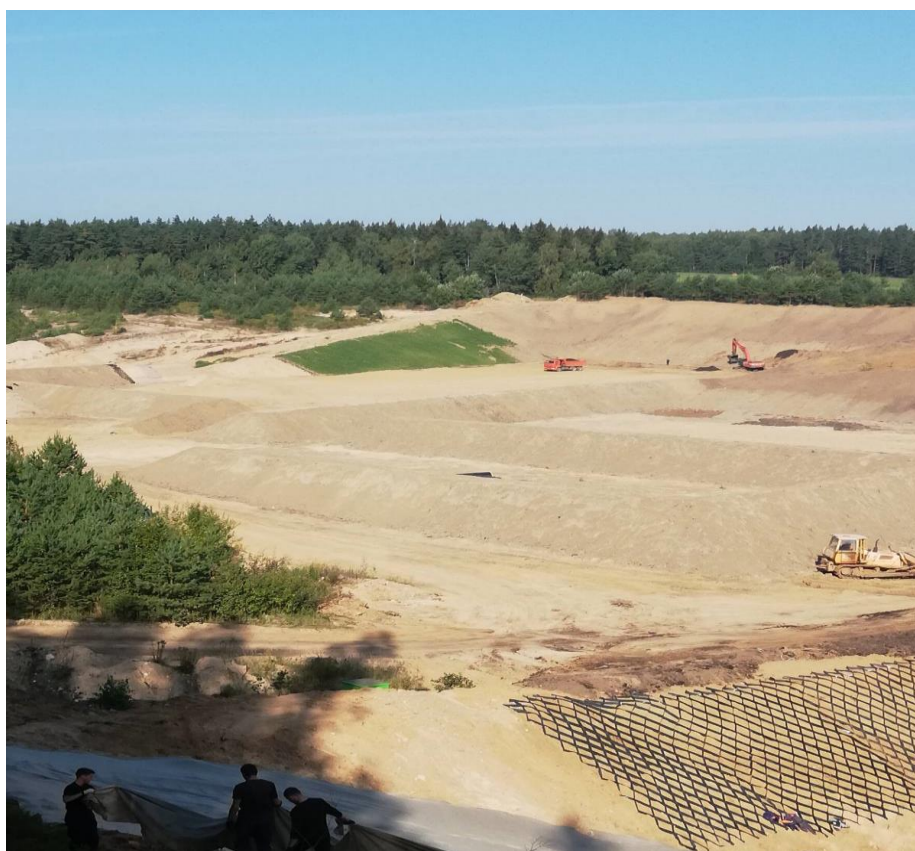
Строительство стрелкового тира ТагерИнвест