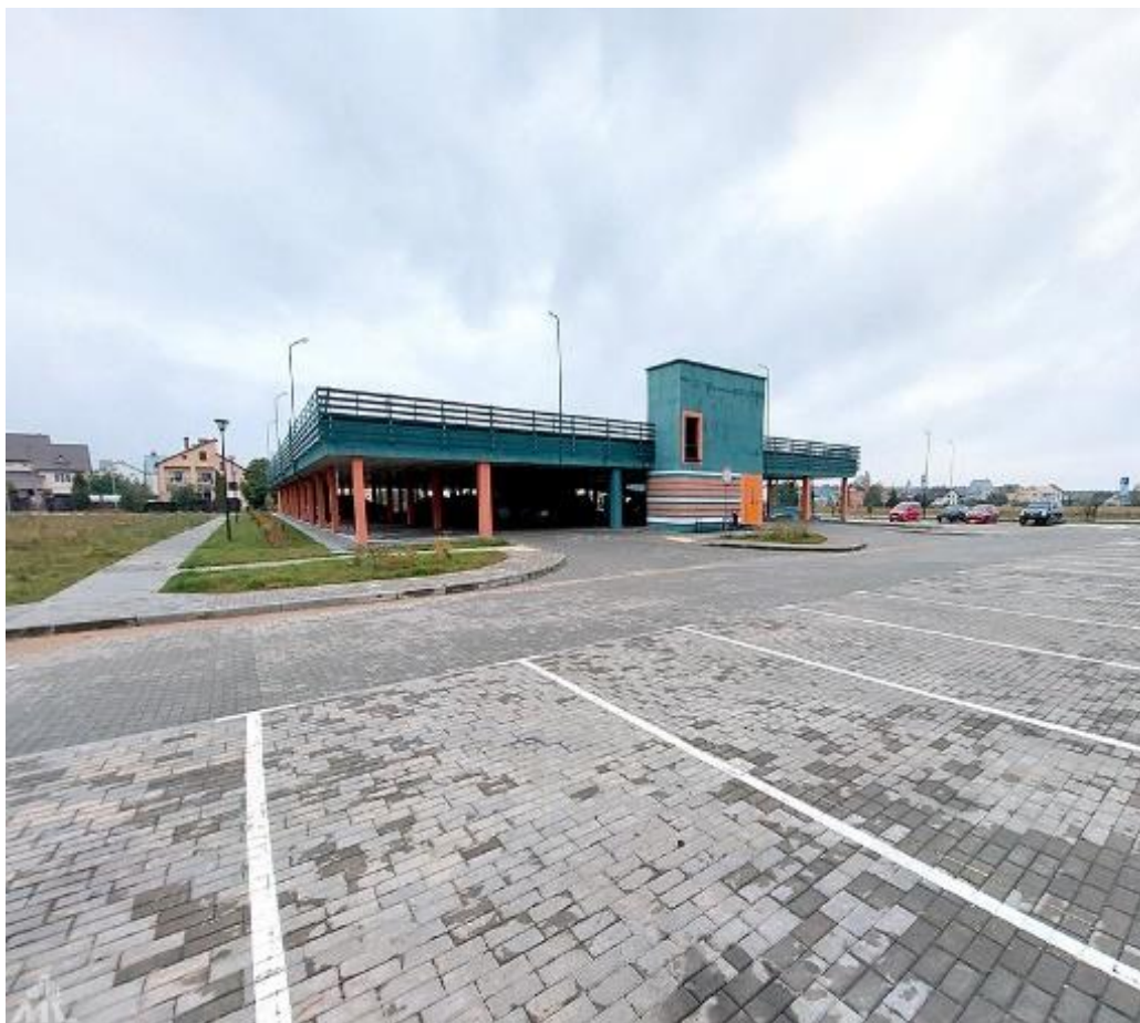
Строительство гараж-стоянки в г.п. Сокол КУП «Минскоблдорстрой»