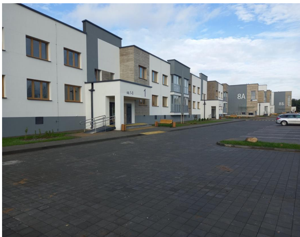
Строительство жилых домов УКС Советского района