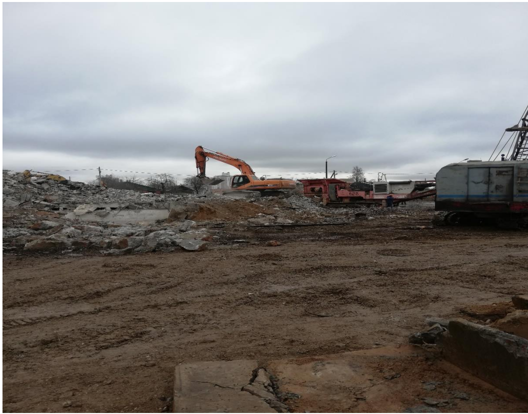
Снос и демонтаж Аэропорта Минск-1