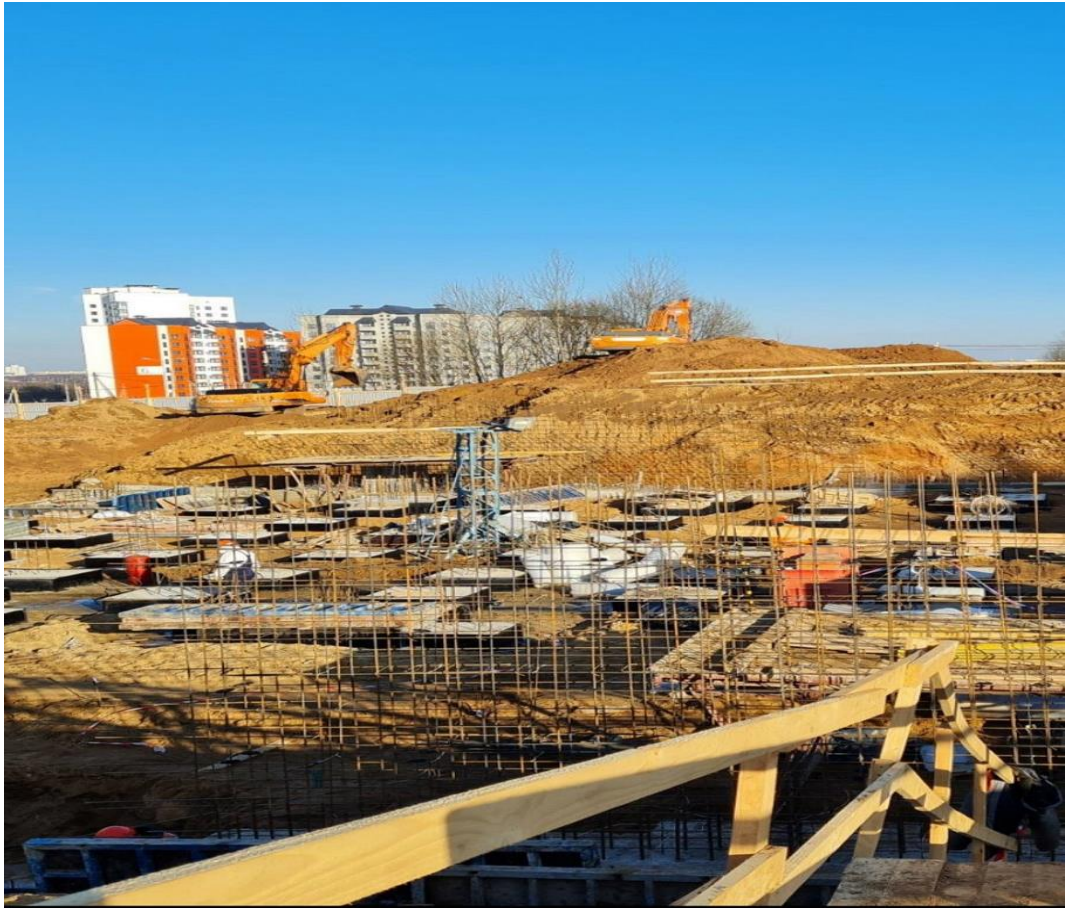
Строительство ФОК Лучины