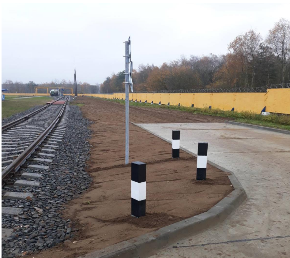
Реконструкция железнодорожного пути г.Лиды «Гроднооблгаз»