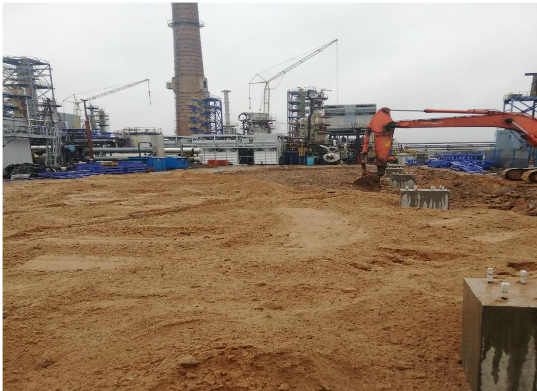
Реконструкция ОАО «НАФТАН»