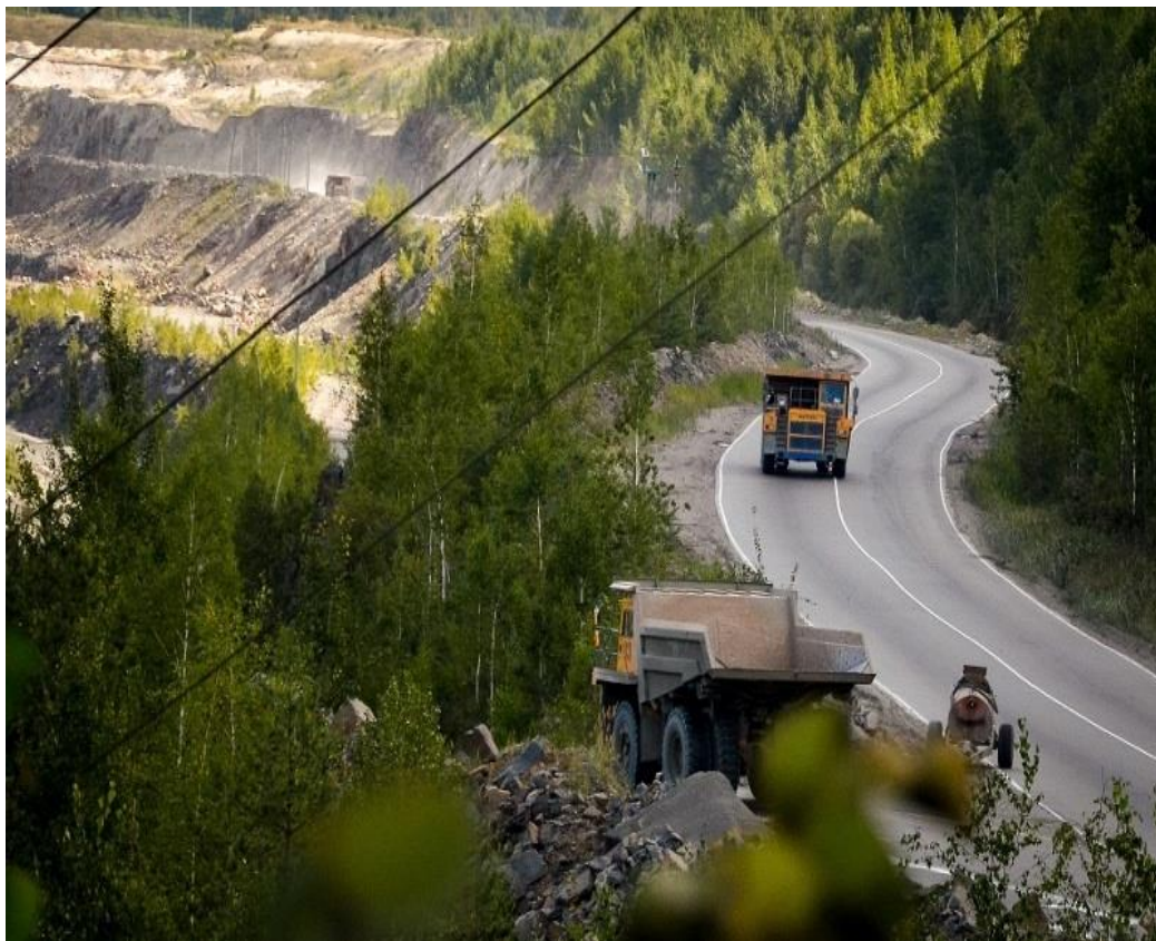
Возведение дороги РУПП «ГРАНИТ»