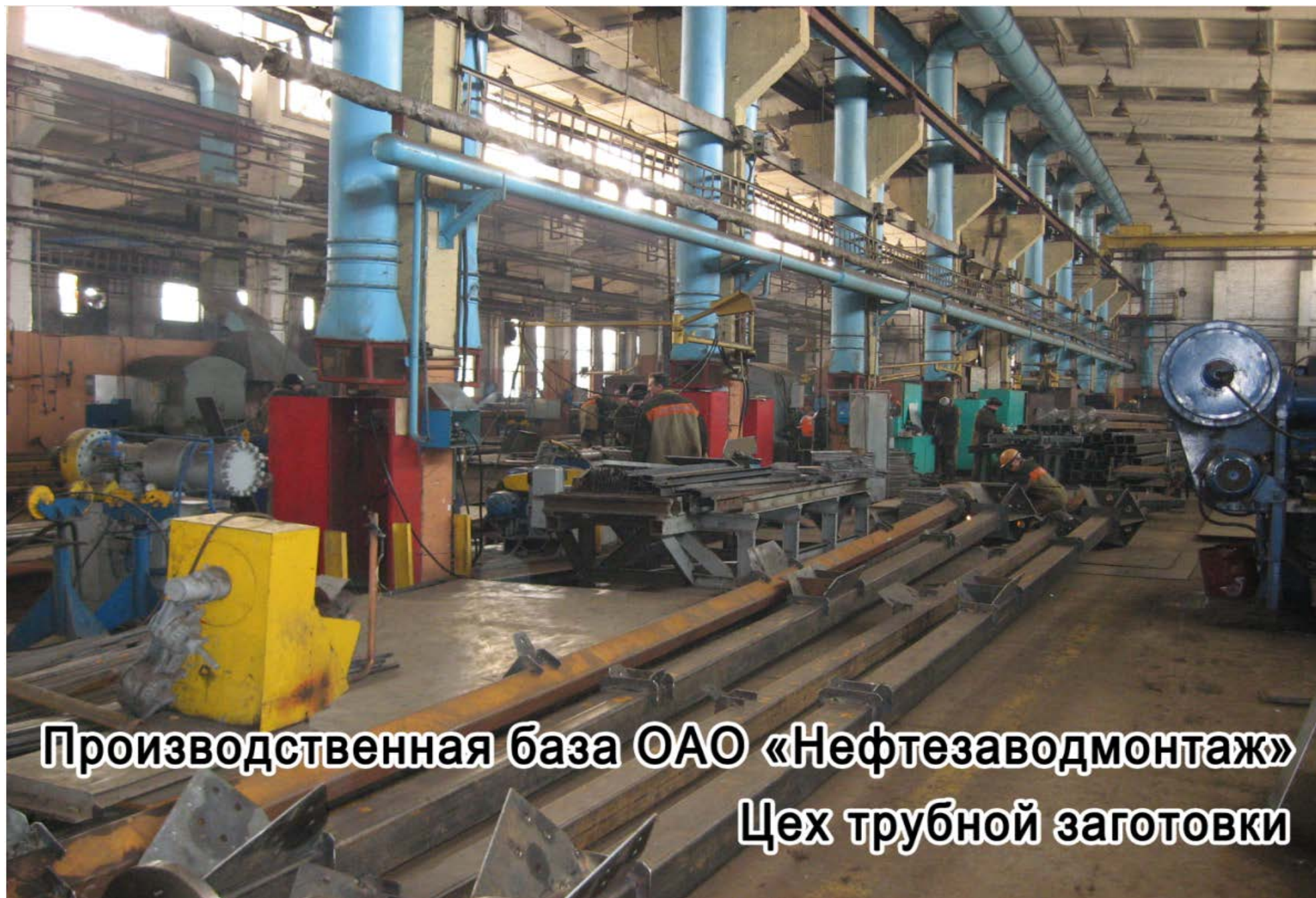
Производственная база ОАО «Нефтезаводмонтаж» Цех трубной заготовки