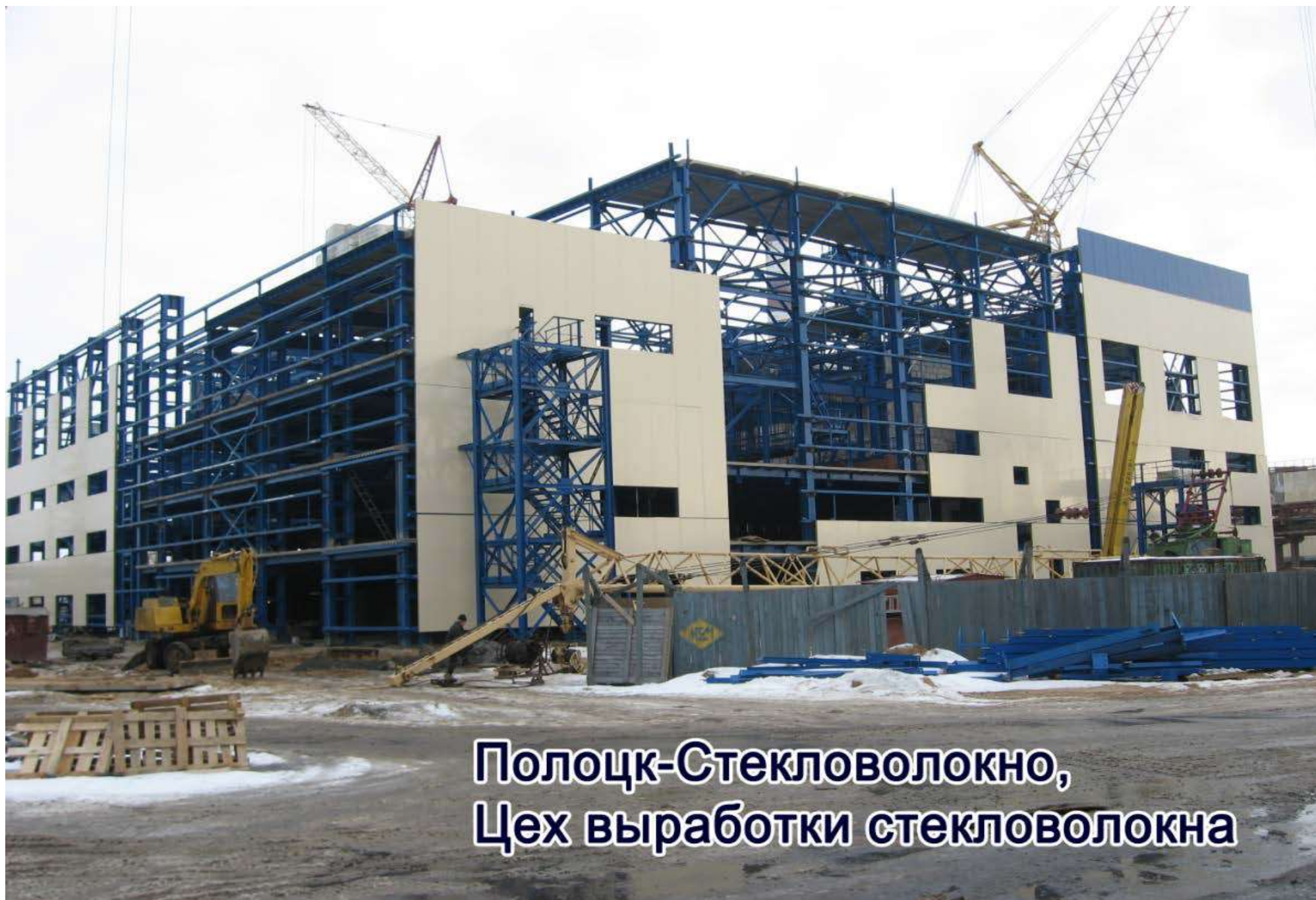
Полоцк-Стекловолокно, Цех выработки стекловолокна