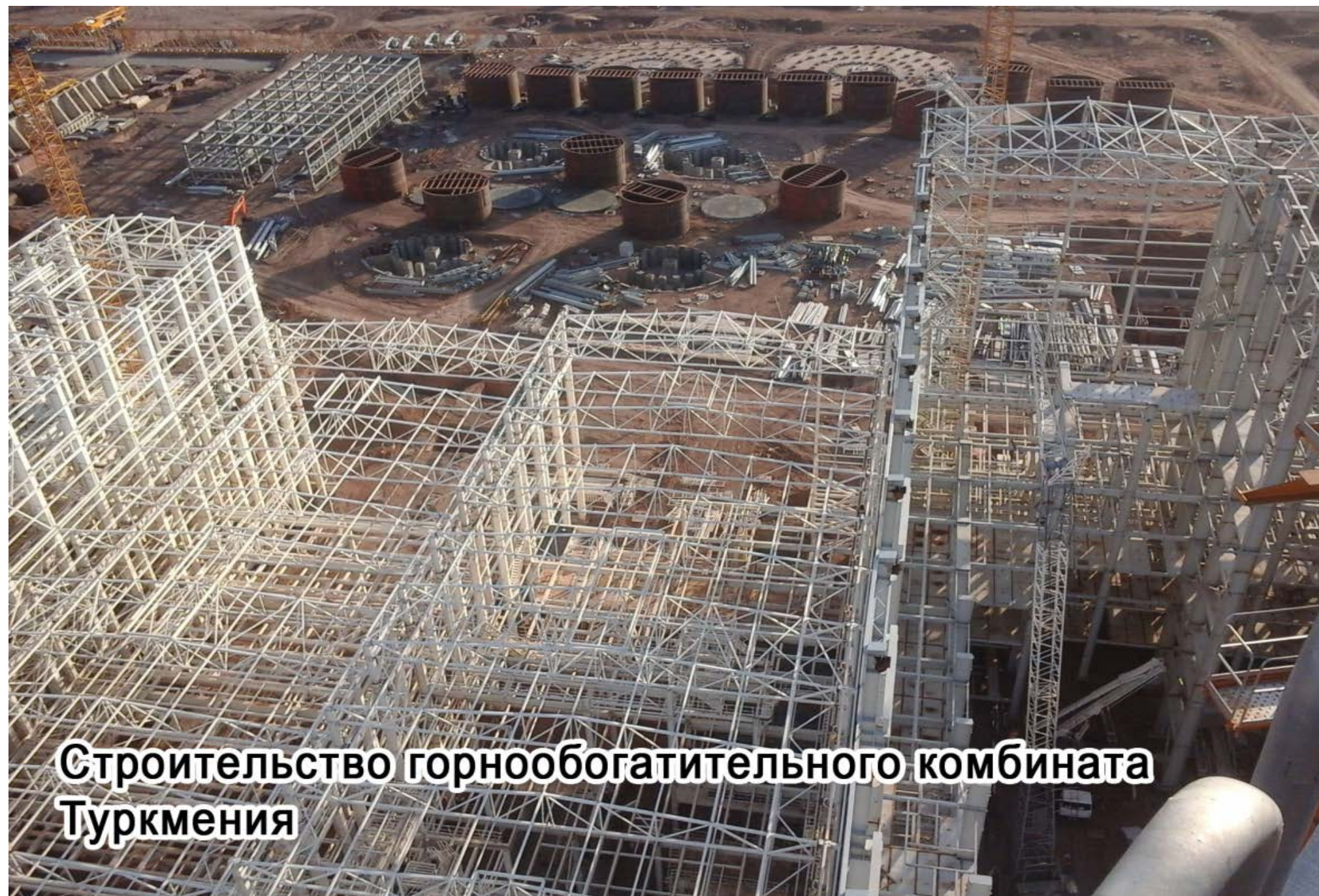
Строительство горнообогатительного комбината Туркмения